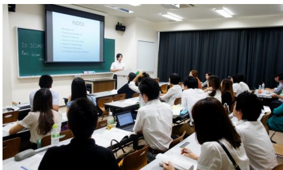
コンカレントセッションの様子

コンカレントセッションでは49件、ラウンドテーブルセッションでは42件の発表が行われました。ラウンドテーブルは、主に大学院生および学部生からの発表であることもあり、若い参加者も多く、熱気・活気にあふれていたように思います。また、韓国の学生と日本の学生が協働で行った調査研究の発表も見られました。研究発表以外にも、ハッピーアワー、懇親会と、インフォーマルなコミュニケーションの場が設定され、参加者間で議論・交流を深めている様子がうかがえました。ICoMEを通じて、参加国・参加者の連携が広がり深まっていることが感じられ、今後、このネットワークがさらに発展していくことが期待されます。(関連 URL http://icome2013.iwd.jp )