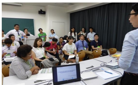
ラウンドテーブルセッションの様子